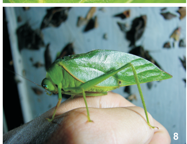
Fig. 1-8: 1. aspecto general Bosque Pluvial Tropical de Premontano predominante en la RBAMB. 2. Copiphora hastata . 3. Limerotopum coronatum . 4. Melanonotus powellorum . 5. Lophaspis scabriuscula . 6. Mimetica mortuifolia . 7. Celidophilla albimaculata . 8. Microcentrum simplex capturado en la trampa de luz.